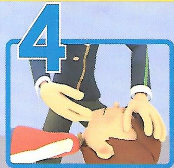
4 Solleva la lingua-mandibola ed esegui lo svuotamento digitale del cavo orale (se corpo estraneo affiorante)