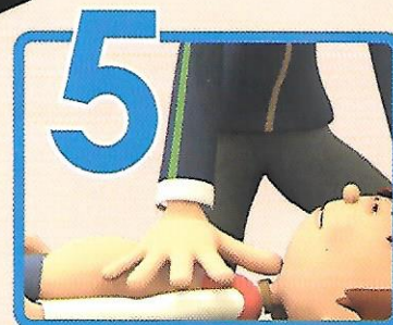
5 Prosegui RCP in attesa del soccorso avanzato