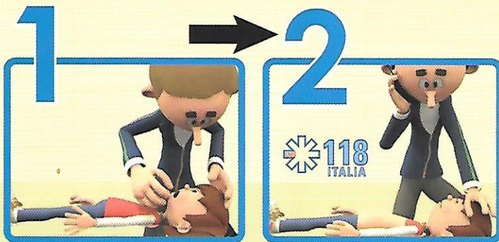
1 Posiziona il paziente su un piano rigido 2 Allerta il 118 senza abbandonare il paziente