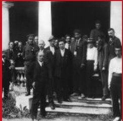
Lenin in primo piano: Il Congresso dell'Internazionale.

Mentre l'Armata Rossa marcia verso Varsavia, in una guerra di conquista "rivoluzionaria", a Mosca si riunisce il secondo congresso dell'Internazionale Comunista, che è di fatto quello di fondazione. L'obiettivo dichiarato è quello di preparare, dopo la rivoluzione russa dell'Ottobre 1917, la rivoluzione mondiale.