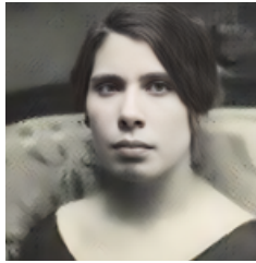
Teresa Noce. Rivoluzionaria Professionale. Red Star Press

Con Teresa Noce ci addentriamo nella Torino in cui nasce l'Ordine Nuovo di Antonio Gramsci, la Torino delle occupazioni delle fabbriche, e dell'evidente divergenza tra i metodi e gli obiettivi dei riformisti rispetto a quelli dei comunisti. Si iscrive - a 21 anni non ancora compiuti - al partito. Caduto il fascismo, farà parte della Costituente e in Parlamento si batterà per i diritti delle donne.